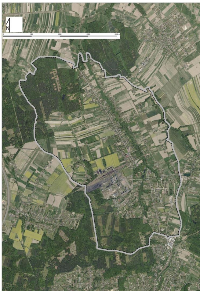
Rys. 1 Gmina Ornontowice na zdjęciu lotniczym z 2019 r.