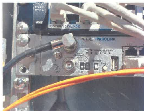
Lokalizacja: Orontowice ul. Zwycięstwa 26a