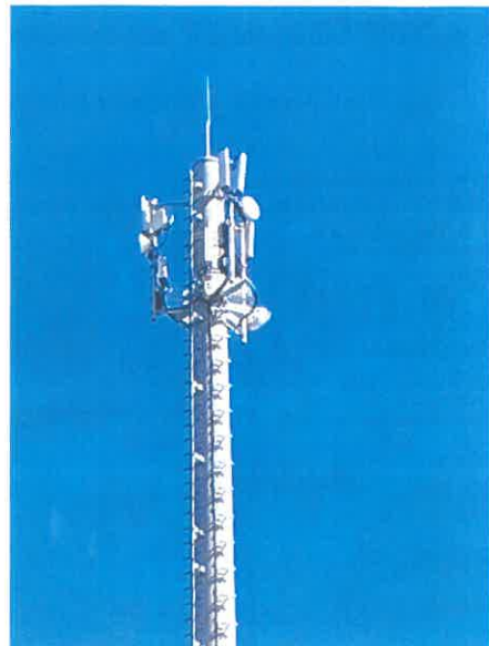
Lokalizacja: Gliwice ul. Pszczyńska